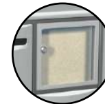
Tableau d'affichage nominatif