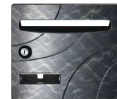
300 Gris médium