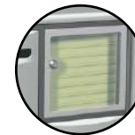
Tableau d'affichage incorporé